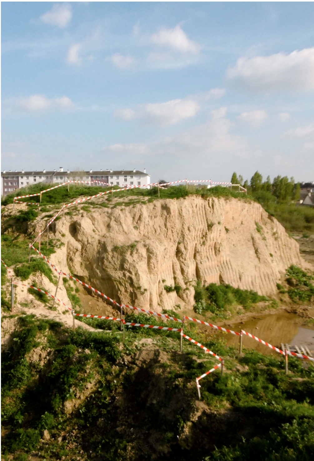
Arzhel Prioul. Aménagement léger . 2017. Saint-Jacques-de-la-Lande.