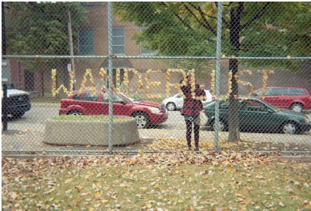
Wanderlust Social Lust. Wanderlust . 2021. Montréal (CA).