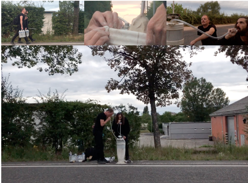
Encastrable. Pourquoi les gâteaux mous deviennent durs et les gâteaux durs deviennent mous ! 2020.