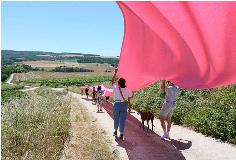
Duo Oran-e. La nappe rose . 2022. Crugny (FR).