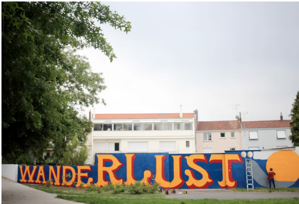
Wanderlust Social Lust. Wanderlust . 2016. La Roche-Sur-Yon (FR).