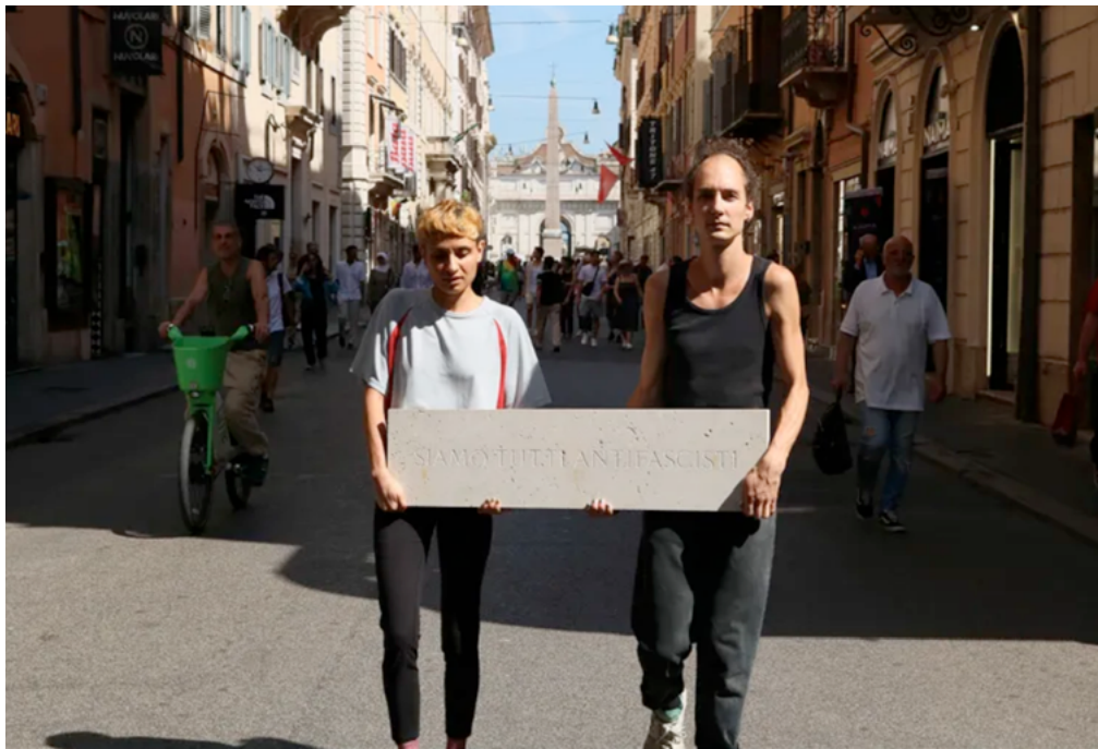
Duo Oran-e. Un'altra Repubblica . 2023. Rome (IT).