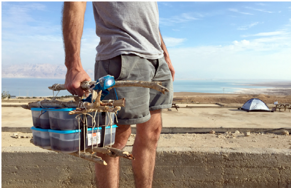
Encastrable. Energy Drink . 2018.