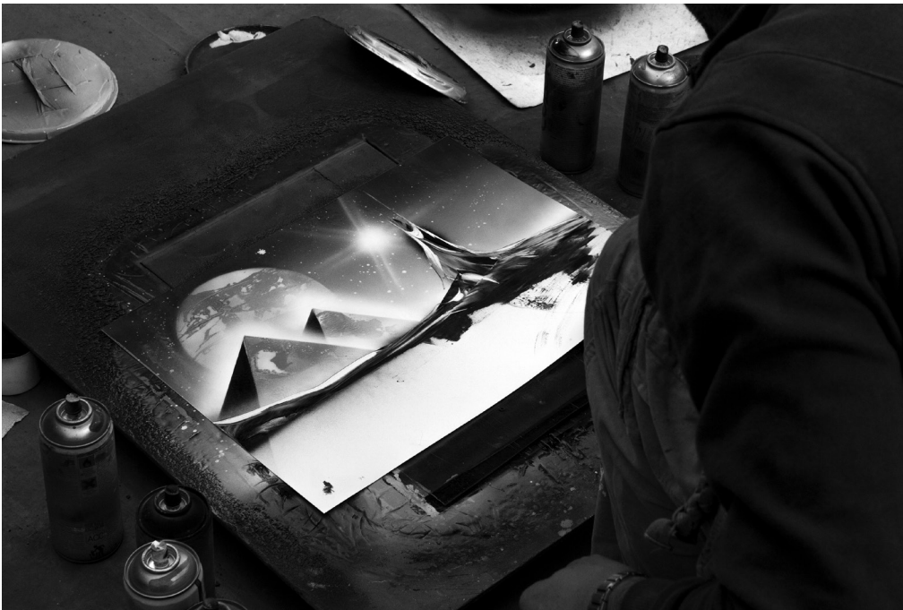
Paysage galactique à l'aérosol, 2014, Belgrade (RS). Photographie : David Renault, Mathieu Tremblin.

vernissage le 30 mai 2014 à 18 h exposition du 29 mai au 25 juin 2014 Straat galerie, Marseille (FR)